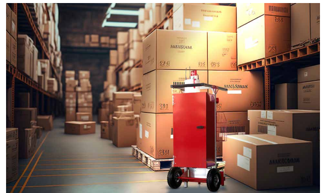
Sicherheit in Lagerhallen und- zelten