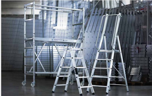
MUNK Günzburger Steigtechnik