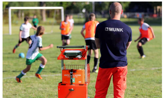
Sicherheit auf Sportveranstaltungen