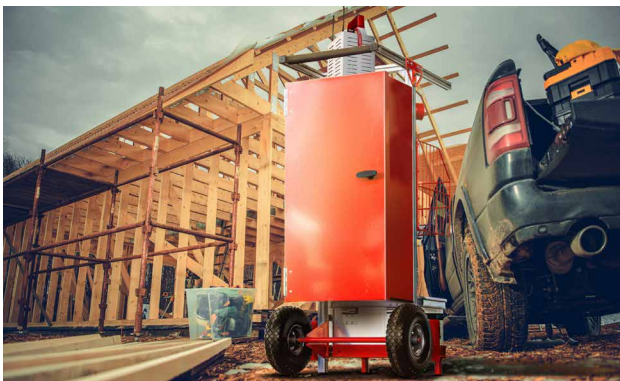
Sicherheit auf Baustellen